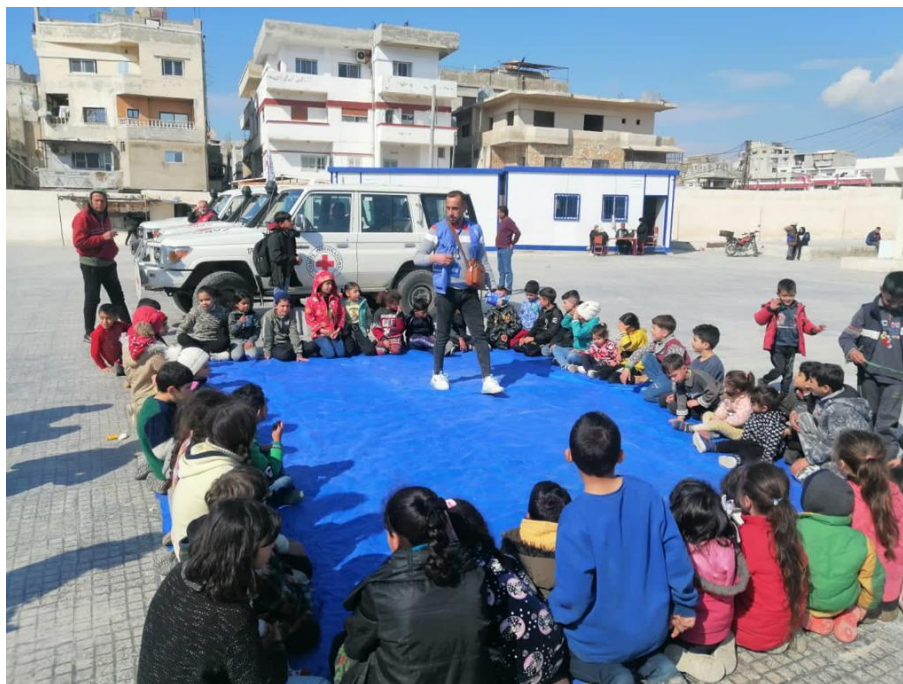
Campamento de Neirab y Ein el Tal (Alepo):

Servicios de salud y apoyos psicosociales y otros servicios de protección como la creación de los lugares amigables siguen ocupando un lugar destacado en la lista de necesidades.