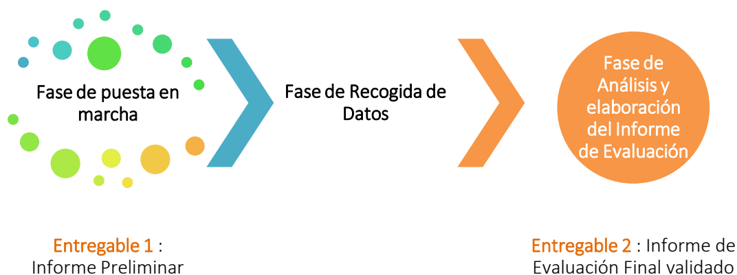
Figura 2 Fases de la Evaluación Final del Proyecto

Este enfoque ha seguido los pasos ilustrados en el siguiente gráfico.